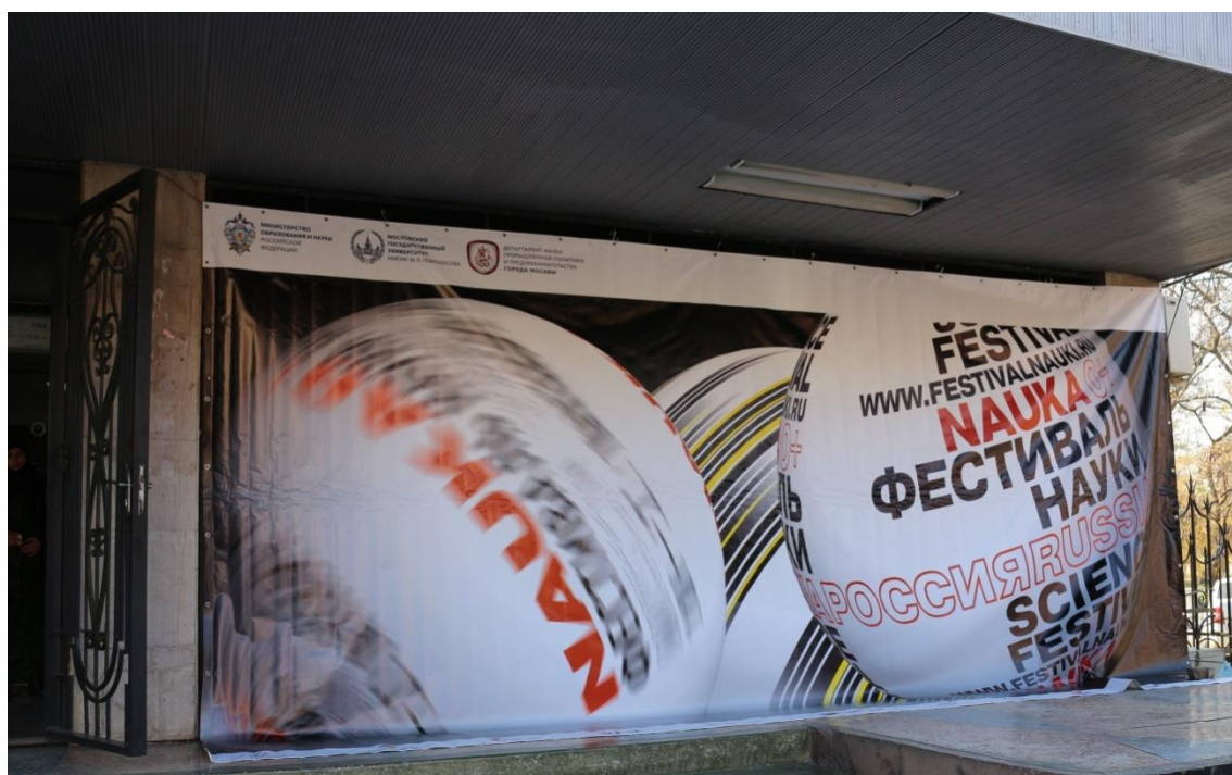
Баннер Всероссийского фестиваля науки при входе в административный корпус ДГУ

7 - 8 ноября 2014 г. на базе Дагестанского государственного университета проходил заключительный молодежный научный форум республиканского этапа Всероссийского фестиваля науки. 7 ноября в конференц-зале ректората Дагестанского государственного университета состоялось официальное открытие Молодежного научного форума «Наука и молодежь - факторы становления инновационного общества», проводимого в рамках Всероссийского фестиваля науки.