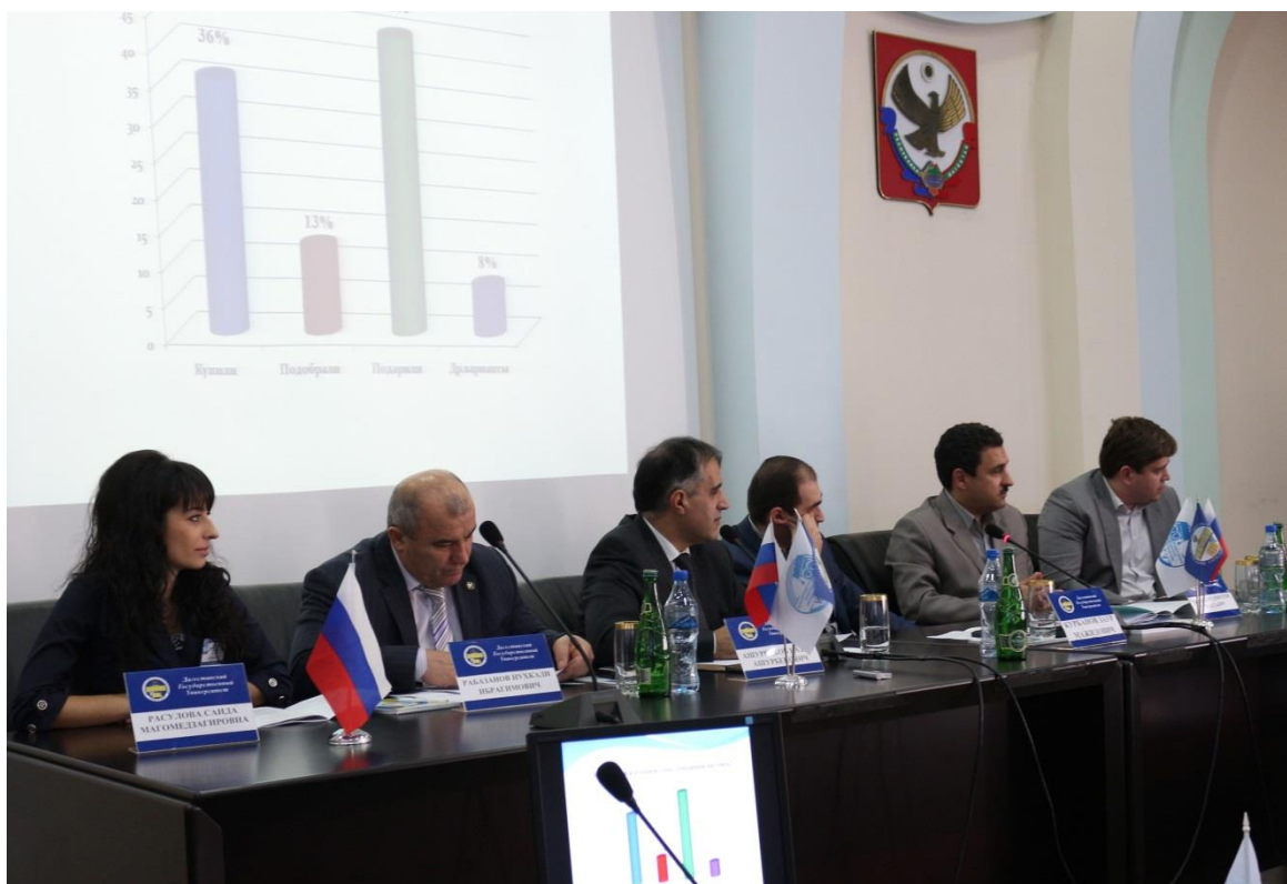
Президиум Молодежного научного форума «Наука и молодежь - факторы становления инновационного общества»