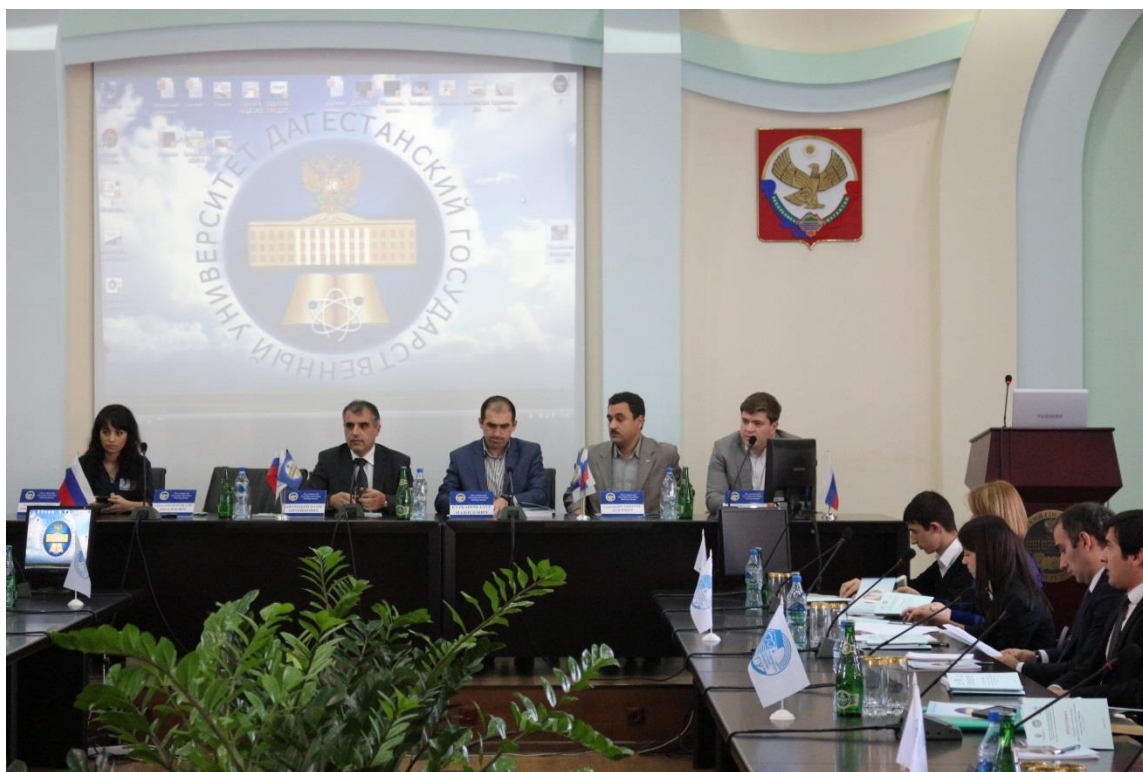
Начало работы Молодежного научного Форума «Наука и молодежь - факторы становления инновационного общества»

В участие форума не было возрастных ограничений. Среди участников форума были и ученики лицеев, студенты колледжей и вузов, аспиранты и молодые преподаватели вузов Республики Дагестан.