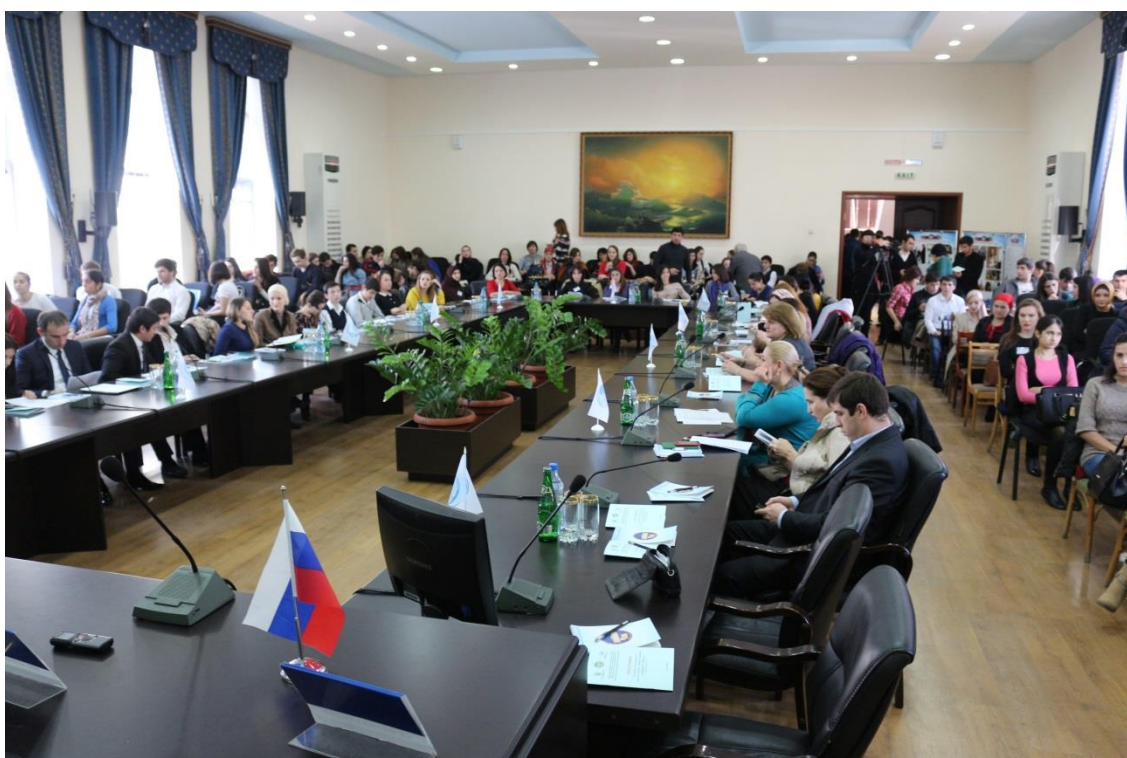
Пленарное заседание Молодежного научного форума «Наука и молодежь - факторы становления инновационного общества»