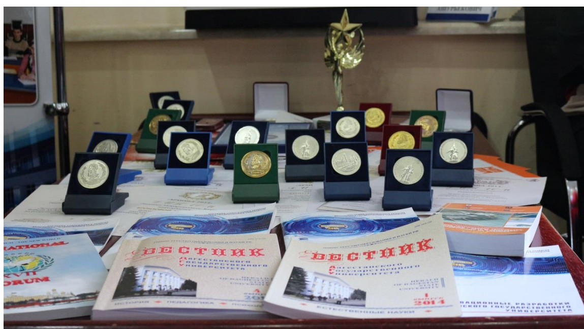
Выставка наград и научно-инновационных достижений студентов ДГУ

Перед конференц-залом ректората ДГУ была открыта выставка инновационных проектов студентов и аспирантов ДГУ. Все участники форума имели возможность ознакомиться с наградами и достижениями студентов и аспирантов Дагестанского государственного университета на выставке научно-инновационных проектов победителей и участников Всероссийских и Международных конкурсов.