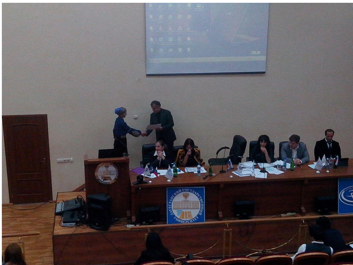
Награждение участников форума «Наука и молодежь - факторы становления инновационного общества»

Назир Ашурбеков пожелал всем участникам молодежного научного форума успехов в их начинаниях и выразил надежду на дальнейшее развитие результативного взаимодействия и сотрудничество научной молодежи образовательных и научных организаций Республики Дагестан.