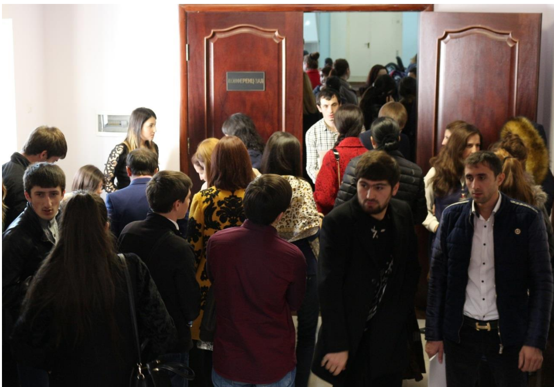
Регистрация участников форума «Наука и молодежь - факторы становления инновационного общества»

Перед конференц-залом ректората ДГУ была открыта выставка инновационных проектов студентов и аспирантов ДГУ. Все участники форума имели возможность ознакомиться с наградами и достижениями студентов и аспирантов Дагестанского государственного университета на выставке научно-инновационных проектов победителей и участников Всероссийских и Международных конкурсов.