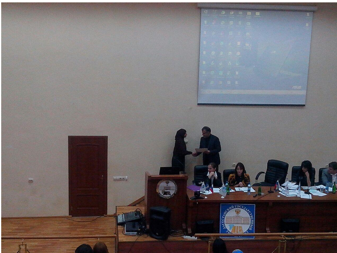
Награждение участников «Наука и молодежь - факторы становления инновационного общества»